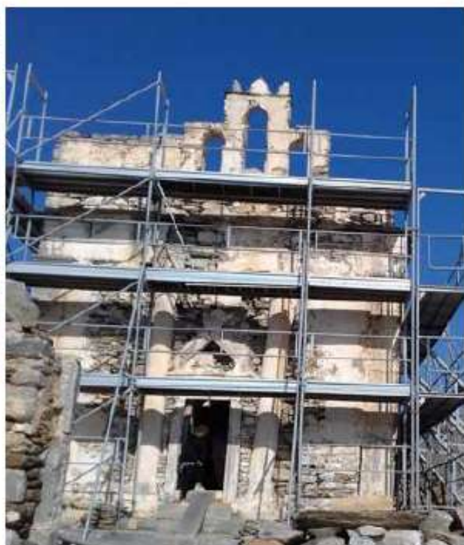
Στερέωση και αποκατάσταση Ναού Επισκοπής Σικίνου / 750 χιλ. €