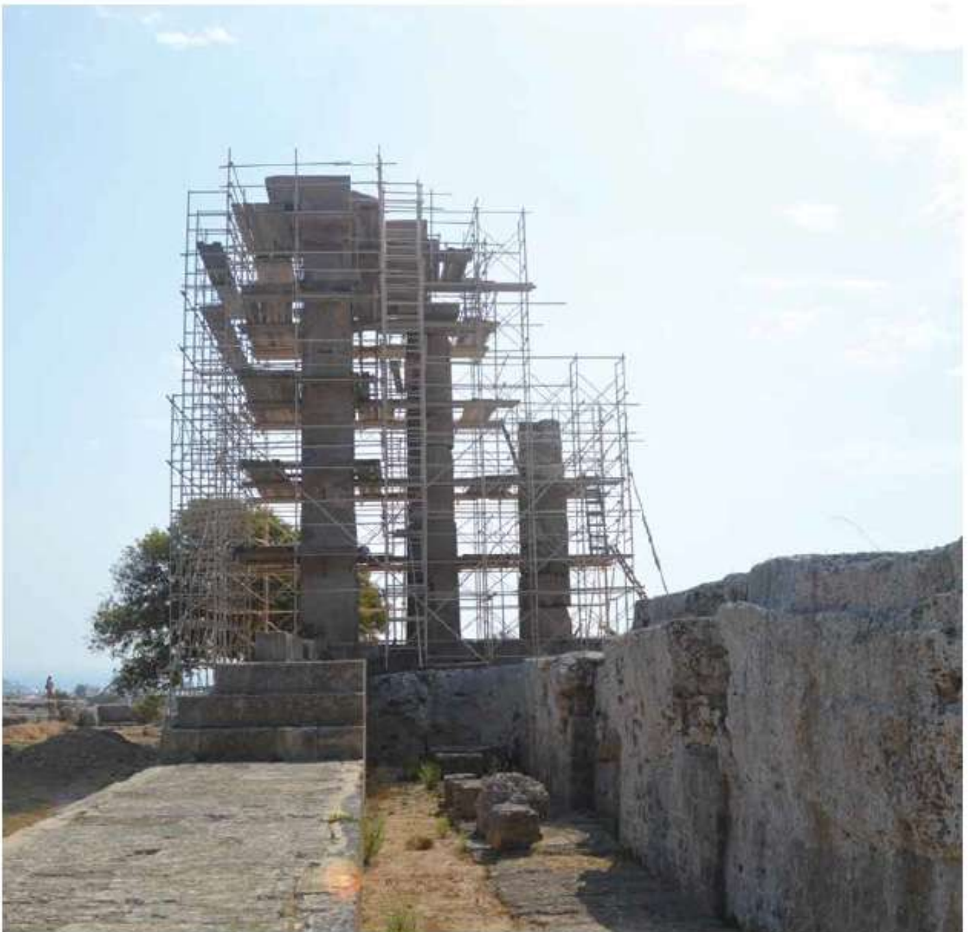
Προστασία και ανάδειξη Αρχαίας Ακρόπολης Ρόδου / 16 εκ. €

Υλοποιούνται δράσεις αποκατάστασης και ανάδειξης μνημείων και αρχαιολογικών χώρων και ενίσχυσης μουσειακών υποδομών και μουσειακών συλλογών.