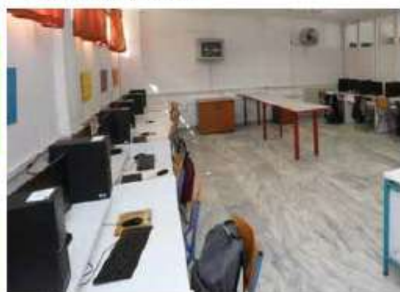
Εξοπλισμός ΤΠΕ σχολικών μονάδων πρωτοβάθμιας και δευτεροβάθμιας εκπαίδευσης Περιφέρειας Νοτίου Αιγαίου / 2,9 εκ. €