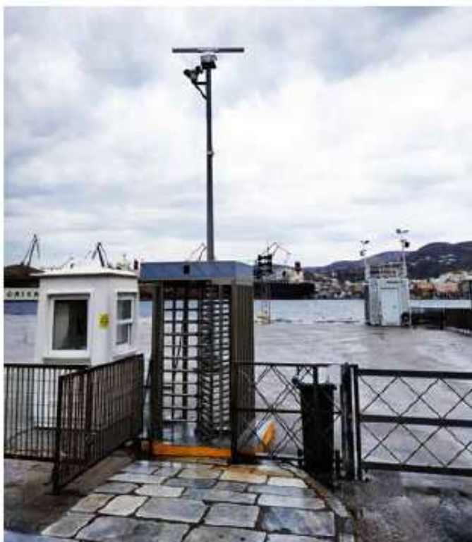
Εγκατάσταση και λειτουργία συστημάτων ασφαλείας Λιμενικών Εγκαταστάσεων Σύρου / 12 εκ. €