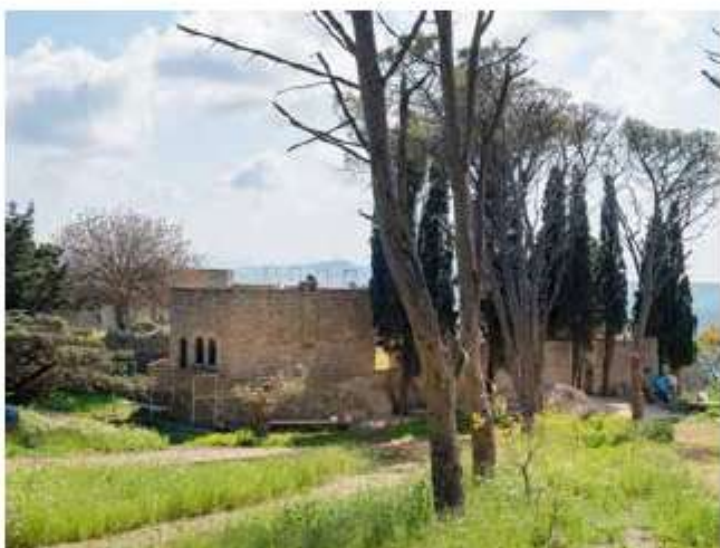
Ανάδειξη και διαμόρφωση του αρχαιολογικού χώρου Ψιλλερήμου Ρόδου / 11 εκ. €