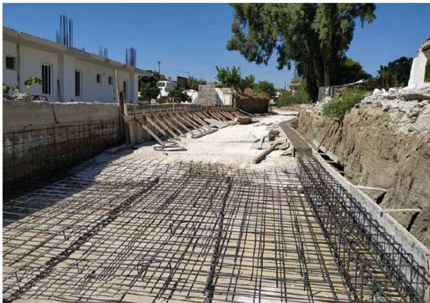
Διευθέτηση ρέματος "Ρένη" στο Ψαληράκι Ρόδου / 389,5 χιλ. €