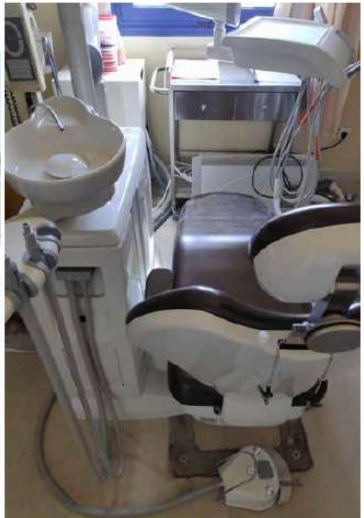
Προμήθεια εξοπλισμού για τις δομές πρωτοβάθμιας φροντίδας υγείας στα μικρά νησιά της Περιφέρειας / 21 εκ. €