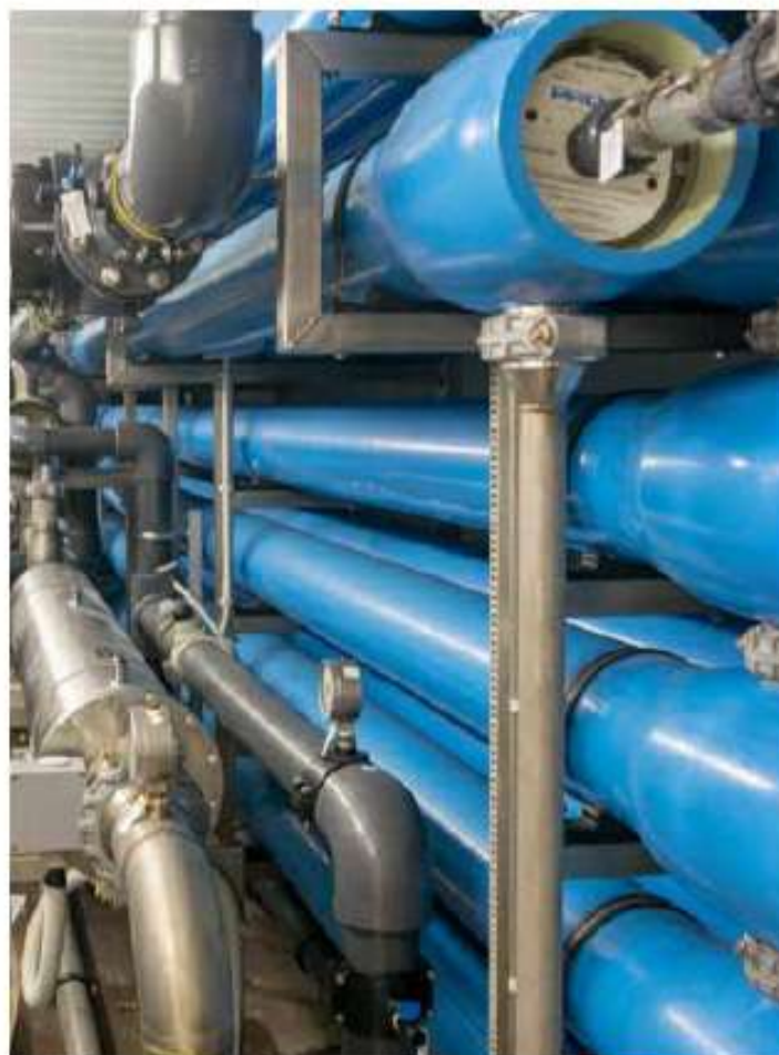
Συμπληρωματικά έργα λειτουργίας των δύο μονάδων Αφαλάτωσης Παροικιάς Πάρου / 410 χιλ. €