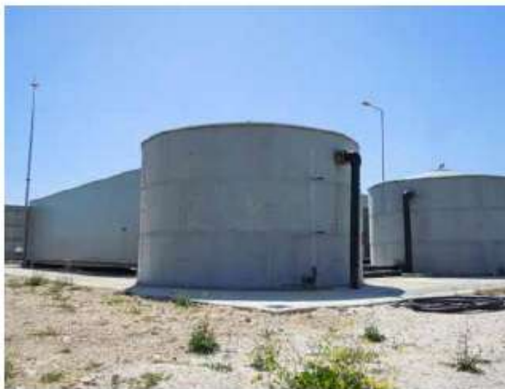
Συμπληρωματικά έργα μονάδας αφαλάτωσης (δυναμικότητας 600κμ. ημερησίως) στην Κίμωλο / 344 χιλ. €