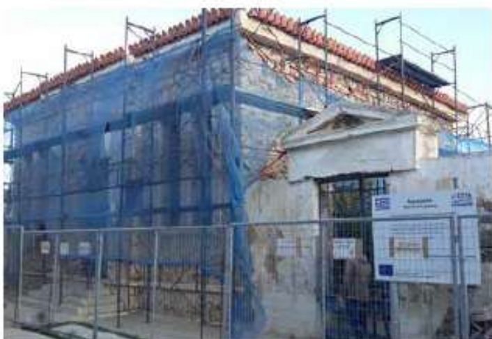
Αρχαιολογικό Μουσείο Κύθνου / 750 χιλ. €