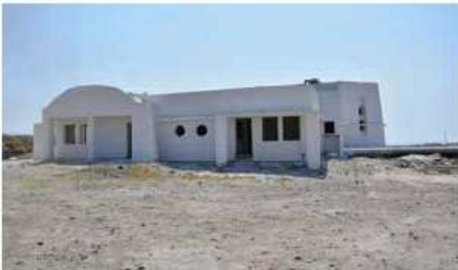
Αποπεράτωση Βρεφονηπιακού Σταθμού Εμπορείου Δήμου Θήρας / 967 χιλ. €