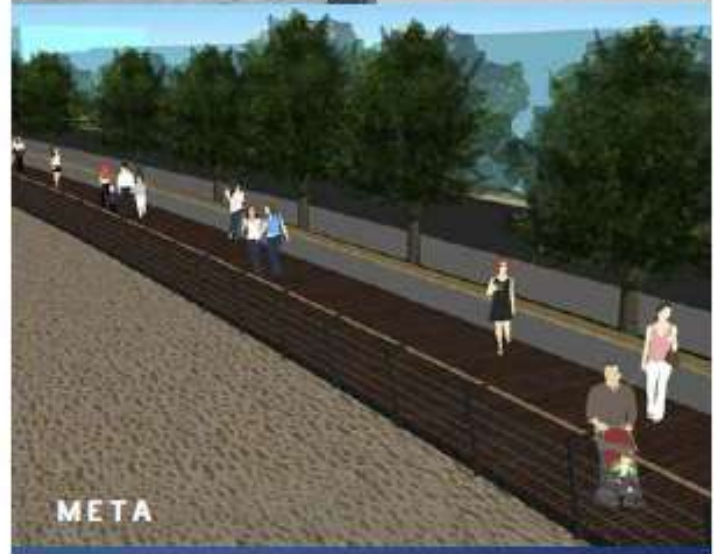
Επέκταση ζυλινου πεζόδρομου επί της οδού Αυστραλίας έως το λιμάνι Ακαντιάς Ρόδου / 778 χιλ. €