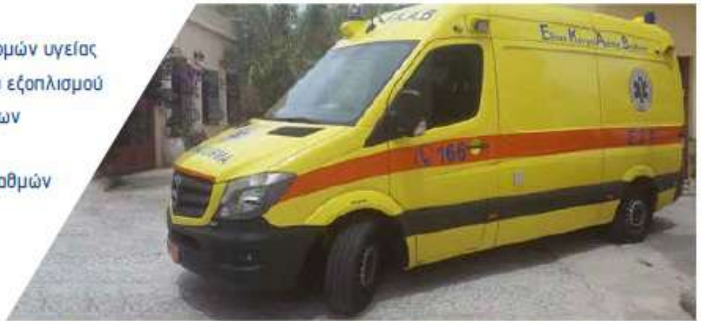
Προμήθεια ασθενοφόρων για τις ανάγκες του ΕΚΑΒ στην Περιφέρεια Νοτίου Αιγαίου / 13 εκ. €