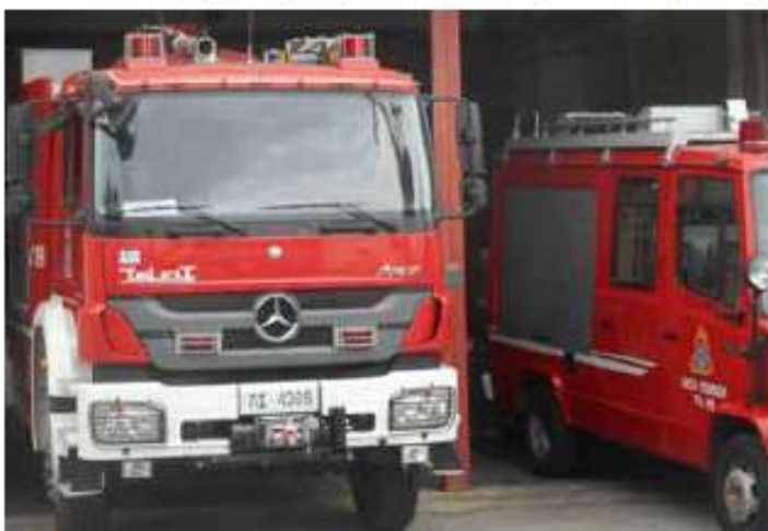
Εξοπλισμός πυροσβεστικού σώματος για την Περιφέρεια Νοτίου Αιγαίου / 29 εκ. €

Υλοποιούνται δράσεις προστασίας και ανάδειξης της φυσικής κληρονομιάς, ανάδειξης φυσικών μνημείων, προστασίας και αποκατάστασης ευαίσθητων περιοχών, έργα αντιμετώπισης κινδύνων και καταστροφών, διαχείρισης νερού και αποβλήτων και εξοικονόμησης ενέργειας σε δημόσια κτίρια και κατοικίες.