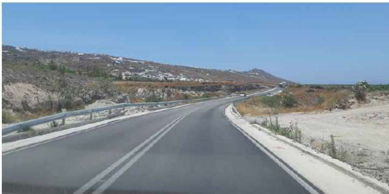
Ολοκλήρωση οδικού δικτύου Αεροδρόμιο - Ψηρά - Βουρβούλο - Οία Θήρας (συνολικού μήκους 12,8 χλμ) / 5,6 εκ. €

Χρηματοδοτούνται έργα βελτίωσης και ενίσχυσης της ασφάλειας των λιμενικών υποδομών, καθώς και οδικά έργα και έργα ασφάλειας του οδικού δικτύου.