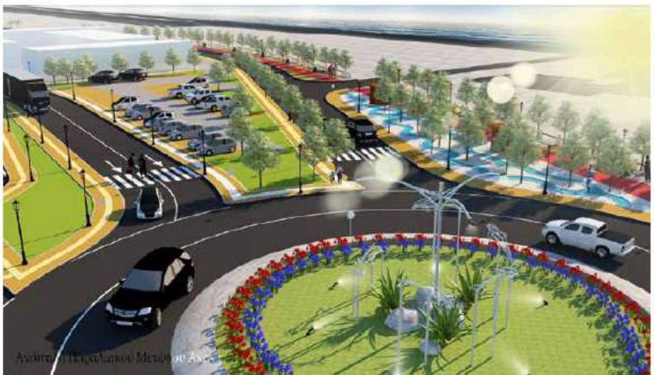
Ανάπλαση και κυκλοφοριακές ρυθμίσεις από το λιμάνι Ακαντιάς έως τη νέα μαρίνα Ρόδου / 2 εκ. €