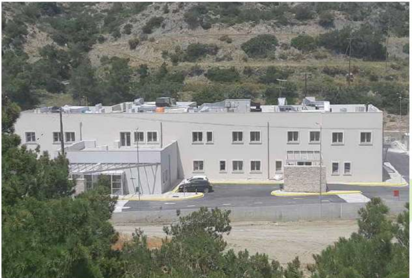
Μελέτη - κατασκευή και εξοπλισμός Γενικού Νοσοκομείου Καρπάθου / 6,6 εκ. €