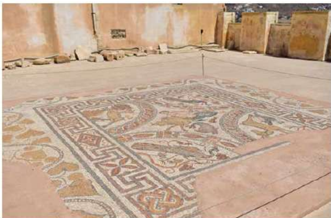
Νησίδα Μουσείων Κάστρου Χώρας Νάξου / 23 εκ. €