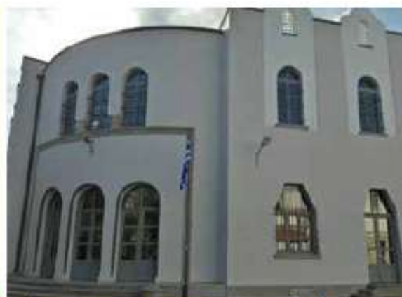
Αποκατάσταση και στατική ενίσχυση 7ου Δημοτικού Σχολείου Κω / 11 εκ. €