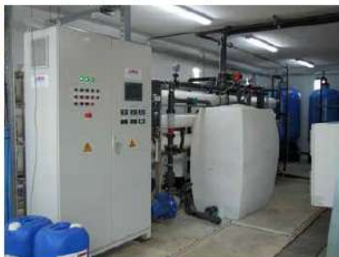
Αφαλάτωση (δυναμικότητα 300κμ. ημερησίως) στην Ηρακλείο / 554 χιλ. €