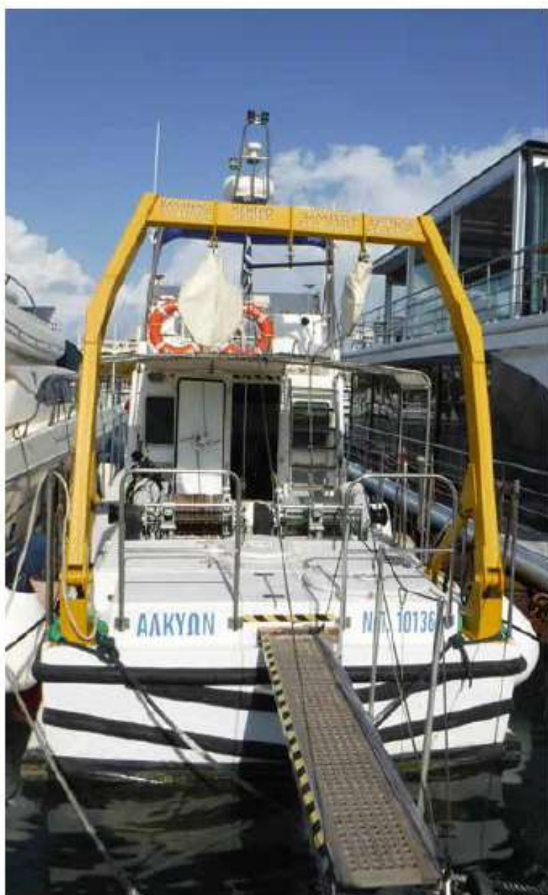
Ανάπτυξη της ερευνητικής υποδομής στον Υδροβιολογικό Σταθμό Ρόδου και το πλοίο «Αλκυών» του ΕΛΚΕΘΕ / 450 χιλ. €

Χρηματοδοτείται η δημιουργία καινοτόμων υπηρεσιών και νέων μορφών τουρισμού και επιχειρηματικότητας.