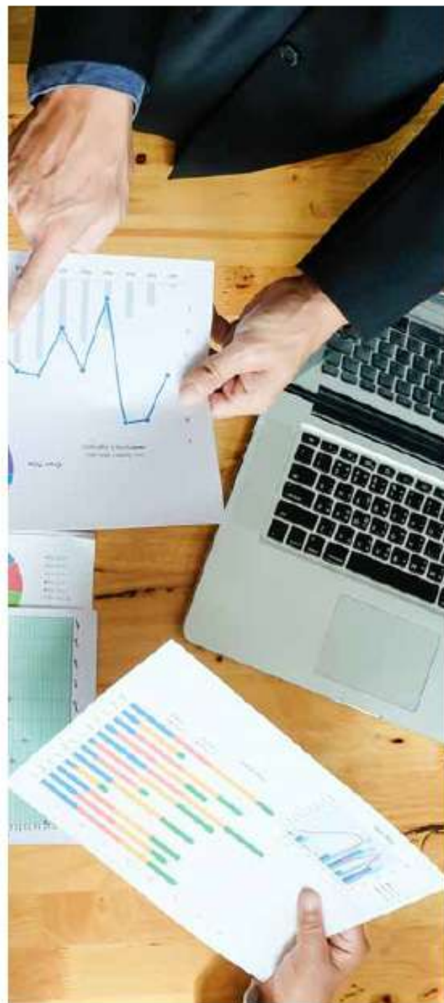
Δράσεις ανάπτυξης της επιχειρηματικότητας / 12 εκ. €