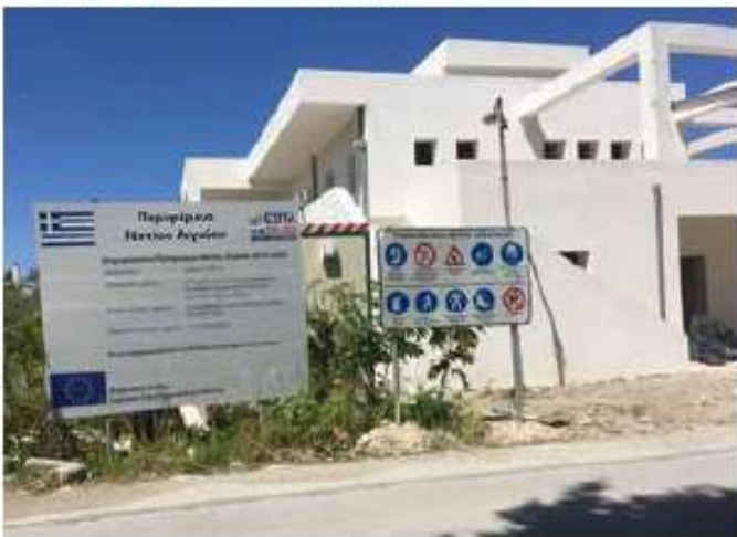
Ανέγερση και εξοπλισμός Βρεφονηπιακού σταθμού Ιαλυσού Ρόδου / 916 χιλ. €