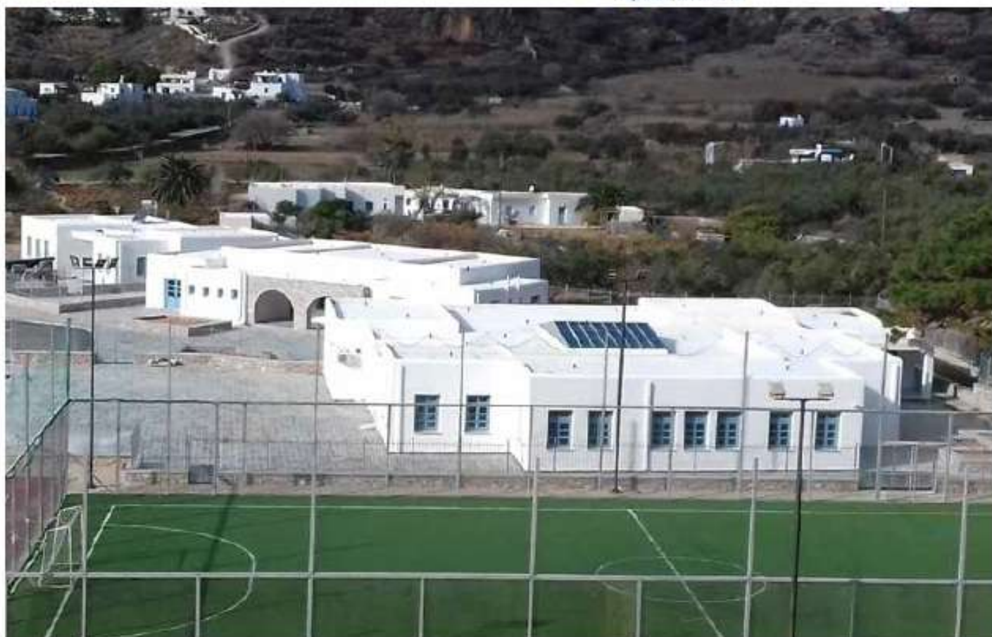
Δημοτικό σχολείο και νηπιαγωγείο Αγιάλης Αμοργού / 16 εκ. €