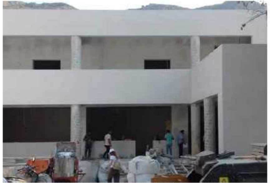
Επέκταση 1ου Δημοτικού Σχολείου Καλύμνου / 7Π χιλ. €