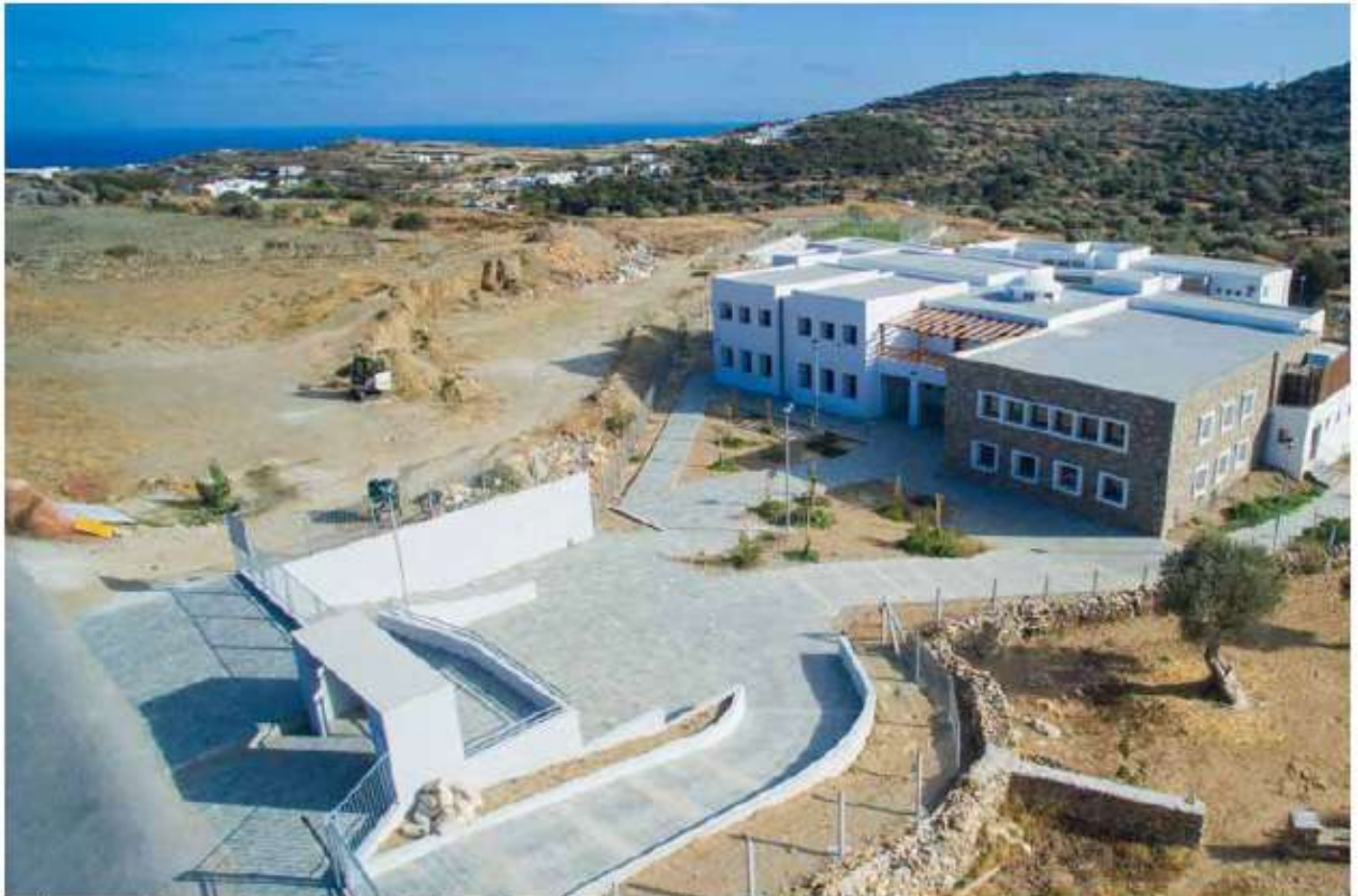
Κατασκευή Δημοτικού Σχολείου Σίφνου / 24 εκ. €