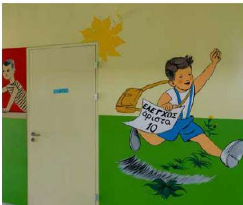
Προσθήκη τμήματος στο 2ο Δημοτικό Σχολείο Χώρας Νάξου / 943 χιλ. €