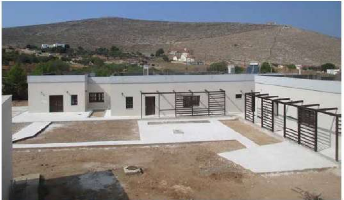
Στέγη υποστηριζόμενης διαβίωσης ΑμεΑ στην Κάλυμνο / 963 χιλ. €