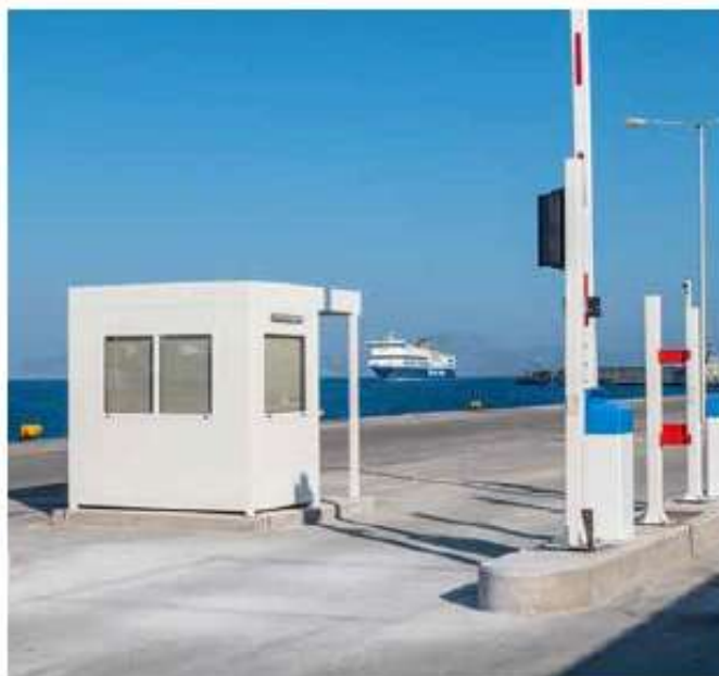
Προμήθεια και εγκατάσταση ολοκληρωμένου συστήματος διαχείρισης ασφάλειας Λιμενικών Εγκαταστάσεων Ρόδου / 3,9 εκ. €