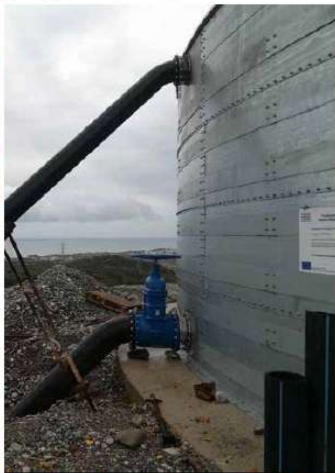
Εξωτερικό δίκτυο (3χλμ) και δεξαμενή (1000 κμ) για την ύδρευση των οικισμών της Νότιας Ρόδου / 240 χιλ. €