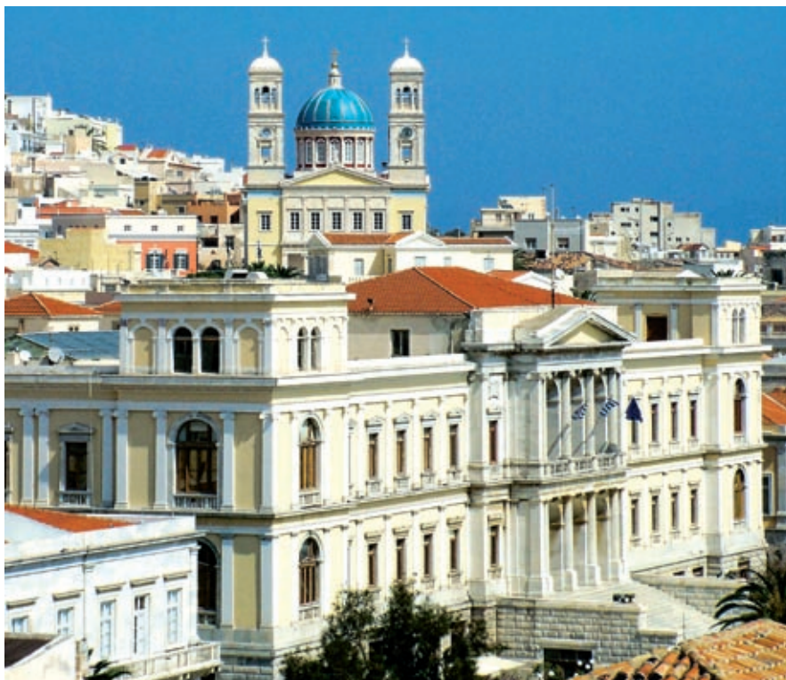
Το Δημαρχείο με φόντο τον Άγιο Νικόλαο