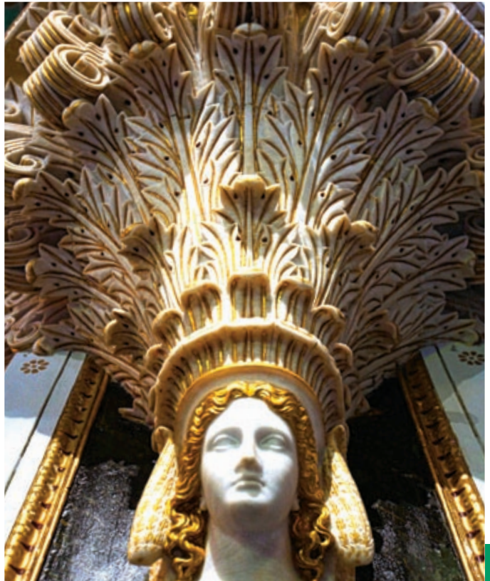
Λεπτομέρεια από τον Άμβωνα στο Ναό του Αγίου Νικολάου