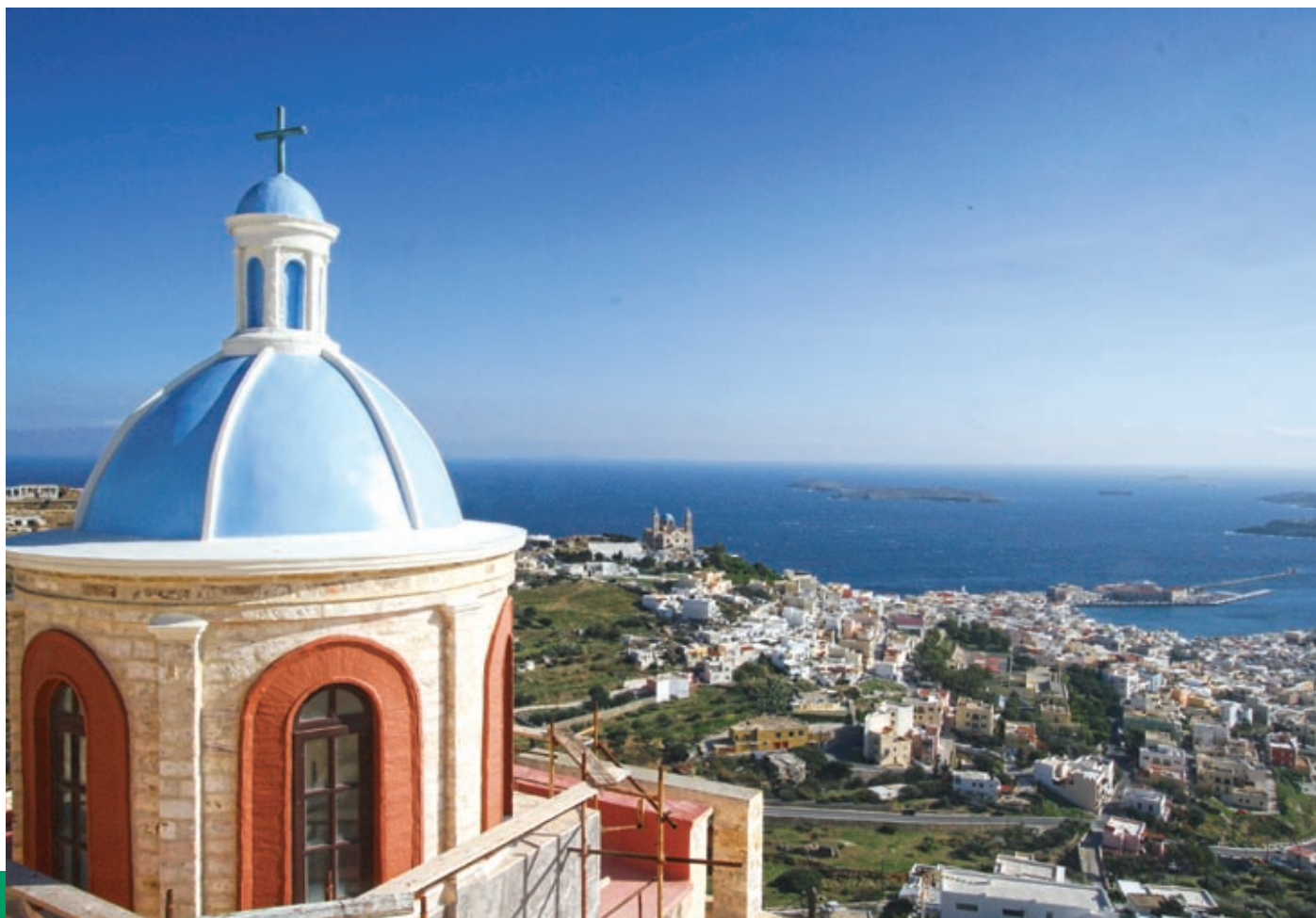
Άποψη της Ερμούπολης από την Άνω Σύρο