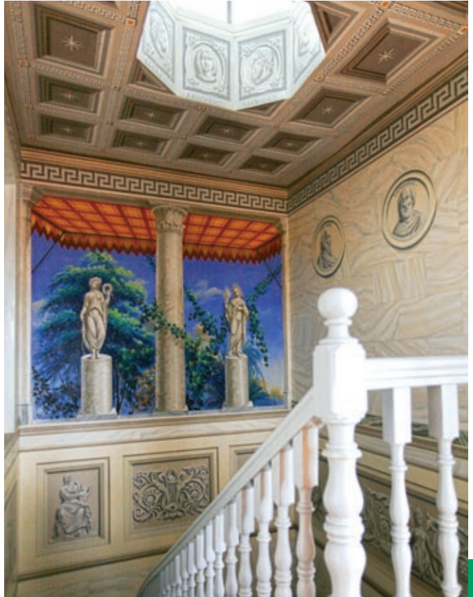
Από το εσωτερικό αρχοντικού της Ερμούπολης

Με φορέα εκτέλεσης το Υπουργείο Πολιτισμού και μελέτη και αδειοδοτήσεις για τις οποίες είχε φροντίσει η Καθολική Επισκοπή Σύρου, ξεκίνησε το Φεβρουάριο 2012 η διάσωση και ανάδειξη ενός σημαντικού μεταβυζαντινού μνημείου, που θα αναβαθμίσει ολόκληρη την περιοχή της Άνω Σύρου. Η αποκατάσταση του εκκλησιαστικού συγκροτήματος, συνολικής έκτασης 1.800 τ.μ. περίπου, στοχεύει να επαναφέρει το ναό στην αρχική του μορφή, όπως τον συνέλαβε, σχεδίασε και κατασκεύασε το 1834 ο αρχιτέκτονας Νικόλαος Χατζησίμος, αλλά και το Παρεκκλήσι του Τιμίου Σταυρού (Βαπτιστήριο), χτισμένο το 1703. Οι επεμβάσεις αφορούν τη μορφολογική και λειτουργική αποκατάσταση του συγκροτήματος, σε συνδυασμό με τη στατική του ενίσχυση. Ήδη, τα πρώτα τμήματα του εσωτερικού διάκοσμου δίνουν μια εικόνα