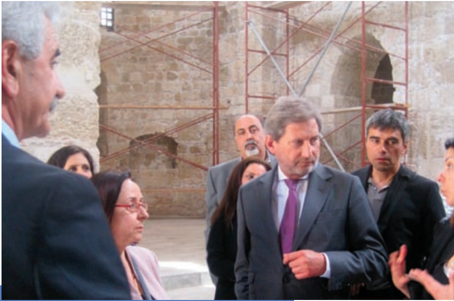
Επίσκεψη στο έργο που εκτελείται στην Παναγία του Κάστρου