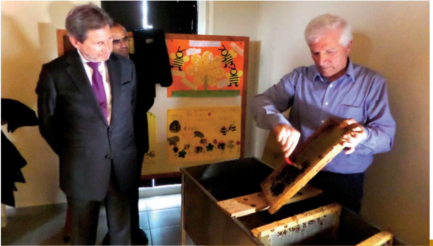
Από την επίσκεψη του Επιτρόπου Γιοχάνες Χαν στη Μελισσοκομική Δωδεκανήσου

ρίπτωση αμύγδαλο, ινδοκάρυδο, φιστίκι, ούζο, σταφύλι, τριαντάφυλλο και πολλές ακόμα γεύσεις), καλλυντικά (μια πλήρη σειρά από κρέμες και γαλακτώματα προσώπου και σώματος με βάση το μέλι), γλυκά (όπως παστέλι, κανταΐφι, μπακλαβά, μαντολάτο κ.ά.), καραμέλες και πάνω από όλα το μελεκούνι, το παραδοσιακό γλύκισμα της Ρόδου που συνηθίζεται να προσφέρεται στους γάμους.