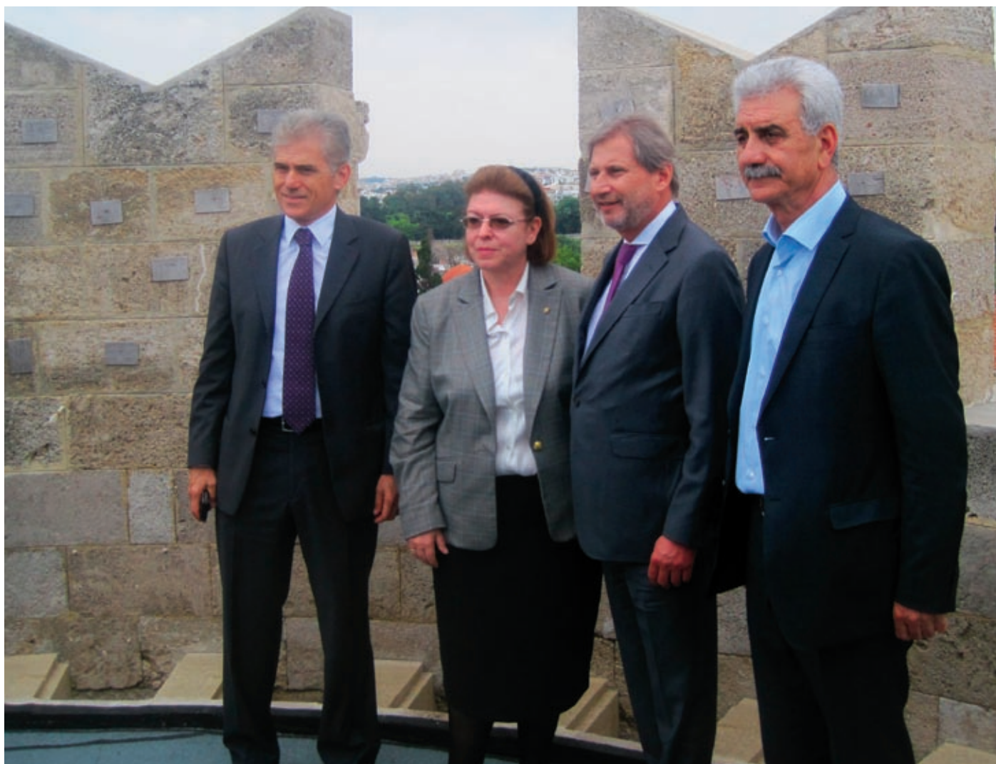
Επίσκεψη στο Παλάτι του Μεγάλου Μαγίστρου. Από αριστερά: Ο επικεφαλής της αντιπροσωπείας της Κομισιόν στην Ελλάδα Πάρις Καρβούνης, η Γενική Γραμματέας του Υπουργείου Πολιτισμού & Αθλητισμού Λίνα Μενδώνη, ο Επίτροπος Γιοχάνες Χαν και ο Περιφερειάρχης Γιάννης Μαχαίριδης