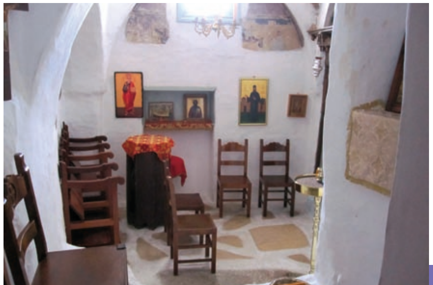
Ι.Ν. Αγίου Νικολάου