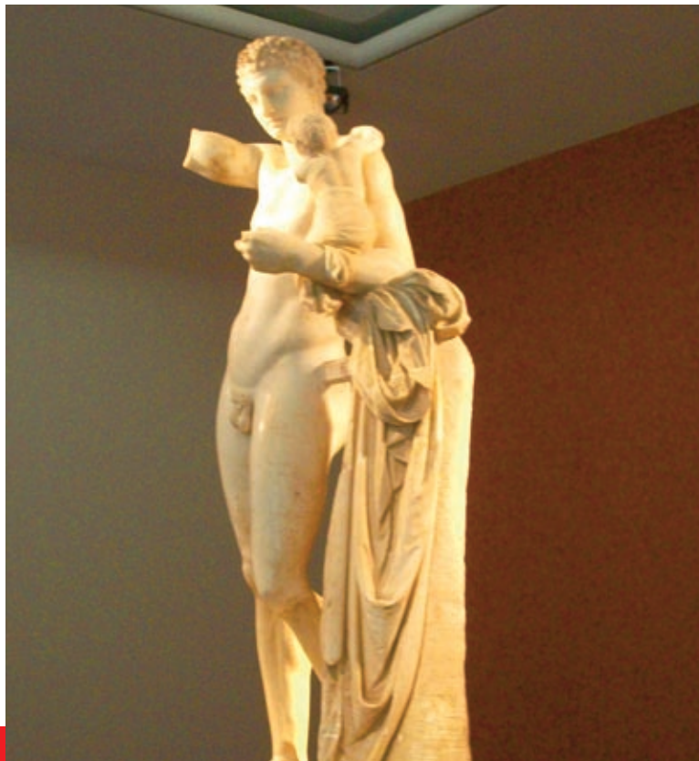
Ο Ερμής του Πραξιτέλη βρίσκεται στο Αρχαιολογικό Μουσείο της Ολυμπίας