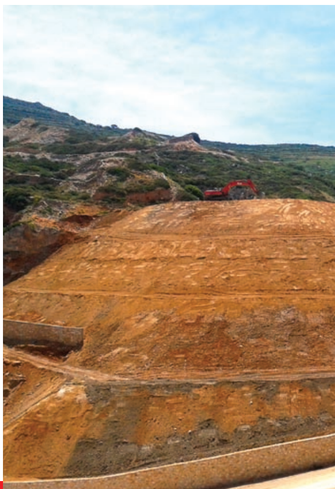
ΧΑΔΑ στο Χωριουδάκι - Λάκκοι