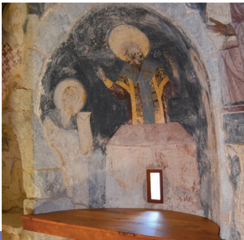
Η Τράπεζα του Ι.Ν. Αγ. Νικολάου μετά τις εργασίες συντήρησης

Γύρω από το σπήλαιο δημιουργήθηκε σταδιακά στο πέρασμα των αιώνων ένα μνημειακό συγκρότημα που αποτελείται από τον κεντρικό λατρευτικό πυρήνα του Σπηλαίου με την εκκλησία της Αγίας Άννας, τους ναούς του Αγίου Νικολάου και του Αγίου Αρτεμίου και ένα λαβυρινθώδες σύνολο κτισμάτων, σύμφωνα με τα παραδοσιακά αρχιτεκτονικά πρότυπα του νησιού. Η συντήρηση και ανάδειξη του συγκροτήματος χρηματοδοτείται από το ΕΣΠΑ (και συγκεκριμένα από το Επιχειρησιακό Πρόγραμμα Κρήτης και Νήσων Αιγαίου) με συνολικό προϋπολογισμό 800,000 €. Το έργο εντάχθηκε στο Πρόγραμμα στα τέλη του 2010 και αναμένεται να ολοκληρωθεί εντός του 2015. Ωρίμασε και υλοποιείται από την 4η Εφορεία Βυζαντινών Αρχαιοτήτων, που με έδρα στη Ρόδο και έχει αρμοδιότητα σε όλη τη Δωδεκάνησο.