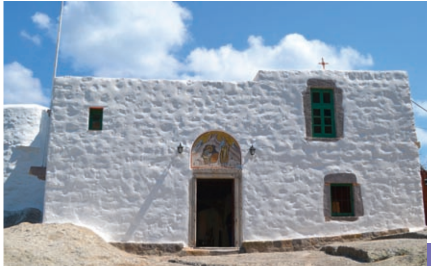
Είσοδος μοναστηριακού συγκροτήματος