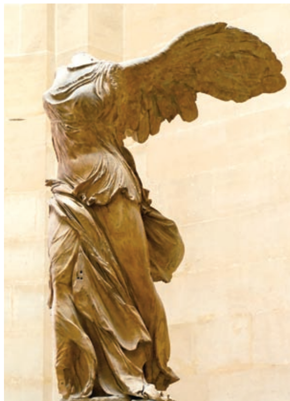
Η Αφροδίτη της Μήλου και η Φτερωτή Νίκη της Σαμοθράκης βρίσκονται στο Μουσείο του Λούβρου