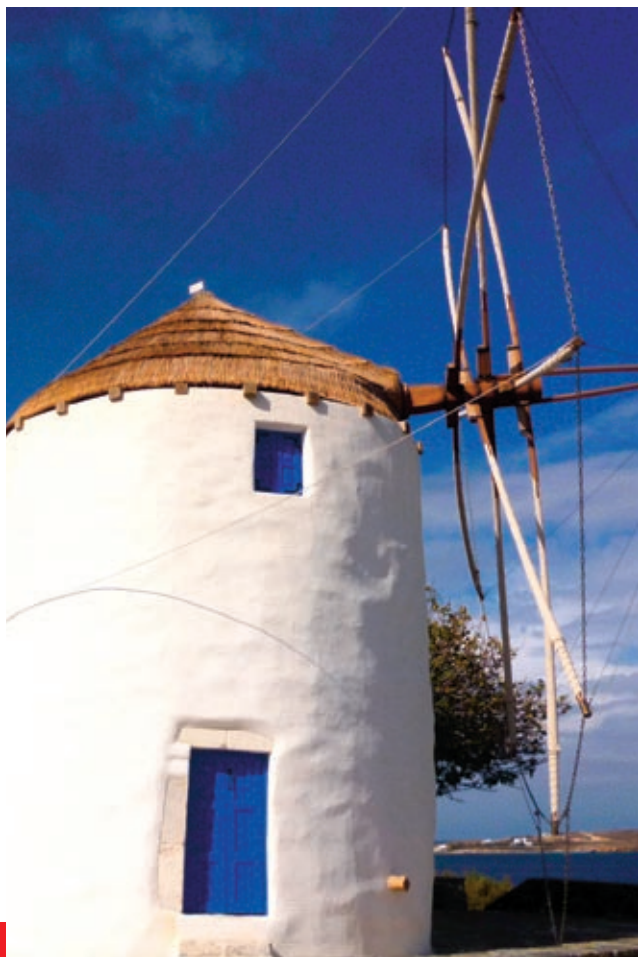
Ανεμόμυλος Αγίας Άννας