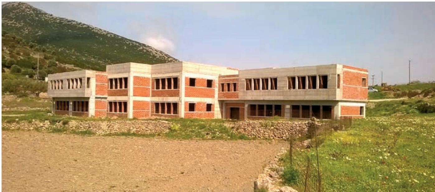
Το νέο δημοτικό σχολείο είναι υπό κατασκευή