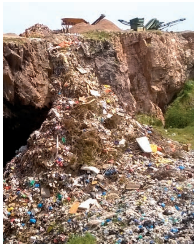
Η χωματερή που θα αποκατασταθεί

Με την παράδοσή του το έργο θα διαθέτει όλα τα χαρακτηριστικά ενός σύγχρονου ΧΥΤΑ, όπως συλλογή και διαχείριση στραγγισμάτων, διαχείριση βιοαερίου και όμβριων υδάτων, κτήριο διοίκησης, φυλάκιο εισόδου, δεξαμενή πυρόσβεσης, εγκατάσταση