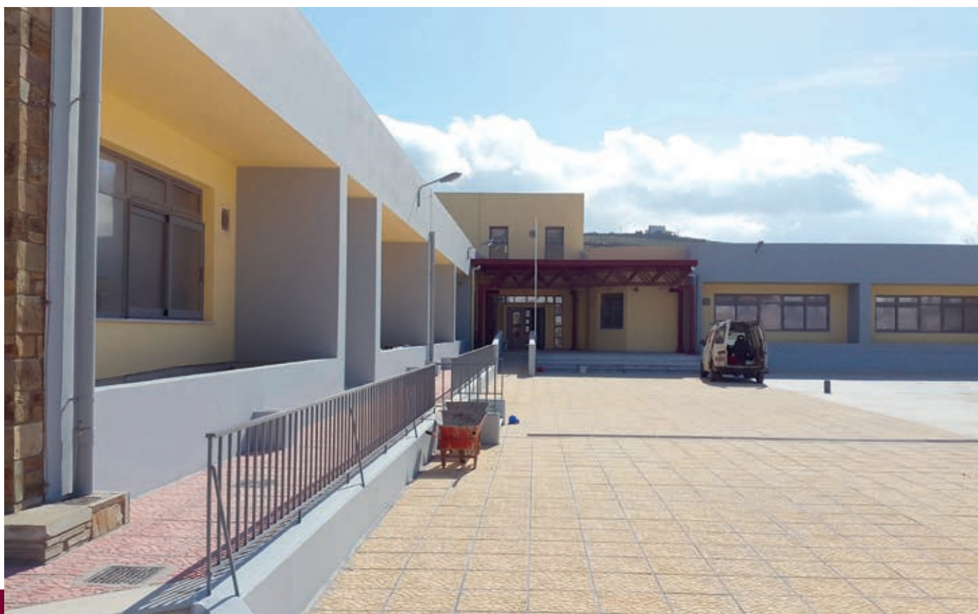
Το σχολείο στα τελικά στάδια των εργασιών, Φεβρουάριος 2015