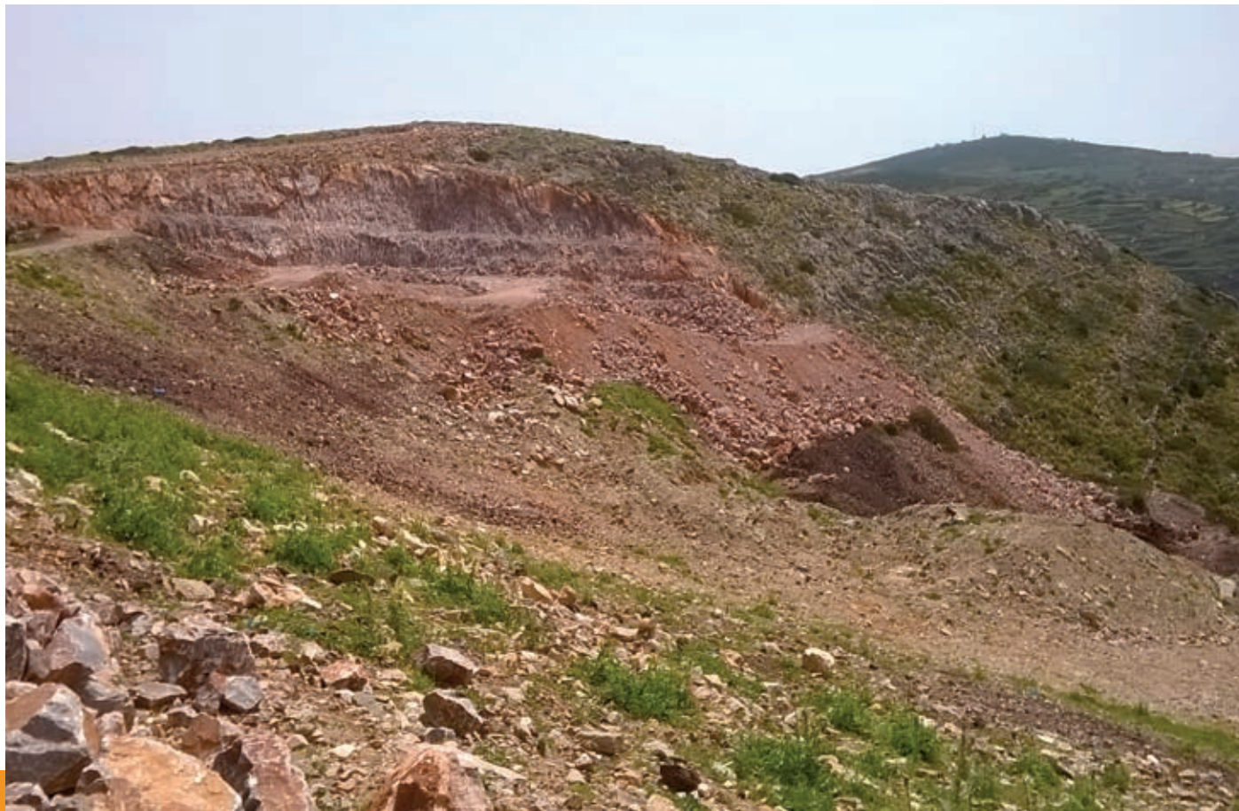
Ο χώρος που θα καταλάβει το κύτταρο του ΧΥΤΑ

κατασκευάζεται ήδη στη θέση «Φυρόγια», σε έκταση που παραχωρήθηκε από την Ιερά Μητρόπολη Σύρου. Όταν ολοκληρωθεί, στα τέλη του 2015, θα διαθέτει δώδεκα αίθουσες διδασκαλίας, εργαστήρια, αίθουσα πολλαπλών χρήσεων, βιβλιοθήκη, εστιατόριο (ώστε να λειτουργεί ως ολοήμερο) και τους απαραίτητους βοηθητικούς χώρους. Από την πλευρά του δρόμου δημιουργείται χώρος προσωρινής στάθμευσης λεωφορείων και οχημάτων για την ασφαλή αποβίβαση κι επιβίβαση των μαθητών. Το συνολικό εμβαδόν είναι 2,370 τ.μ. και η δυναμικότητά του 300 μαθητές. Ευνόητο είναι ότι με τη λειτουργία του νέου σχολείου (το πιθανότερο από την σχολική χρονιά 2016-2017) θα παύσει η χρήση των υπαρχόντων χώρων στους τρεις οικισμούς.