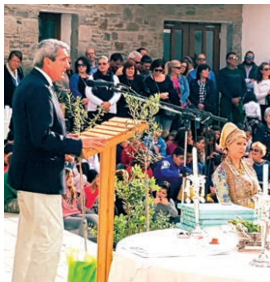
Στιγμιότυπα από την τελετή των εγκαινίων του σχολείου

εκ. ευρώ. Το έργο ολοκληρώθηκε τον Ιούλιο του 2016, εγκαινιάστηκε τον περασμένο Οκτώβριο και άρχισε να λειτουργεί από τις αρχές Νοεμβρίου.