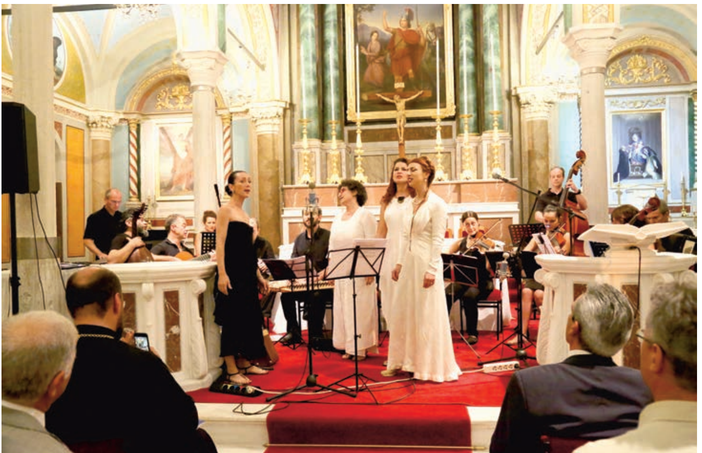
Η Ορχήστρα των Κυκλάδων στο καλλιτεχνικό πρόγραμμα της εκδήλωσης στον Καθεδρικό Ναό του Αγίου Γεωργίου της Άνω Σύρου