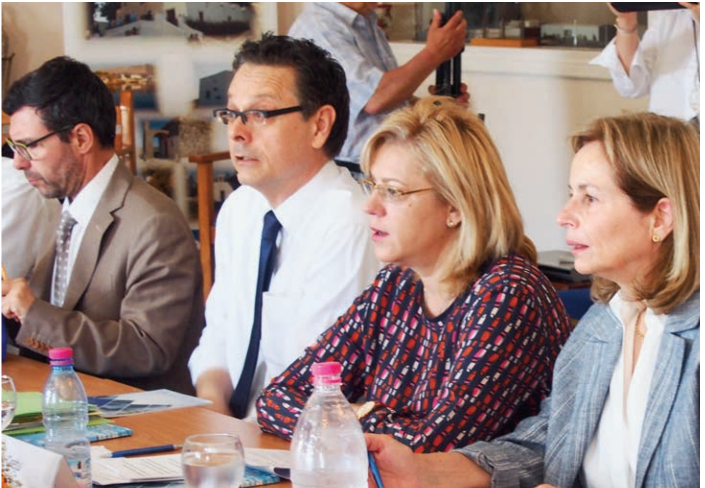
Από αριστερά: ο αναπληρωτής προϊστάμενος στην DG Regio Π. Πανταζάτος, το μέλος του Επιτελείου της Επιτρόπου Ι. Λατούδης, η επίτροπος C. Crețu και η μεταφράστρια Ελ. Καμιά

Μέσα σε διάστημα λίγων μηνών, η Επίτροπος Corina Crețu, που είναι αρμόδια για την Περιφερειακή Πολιτική της Ευρωπαϊκής Ένωσης, βρέθηκε στη χώρα μας δύο φορές. Η δεύτερη από τις επισκέψεις της, από τις 13 έως τις 15 Ιουνίου, είχε σκοπό να τη φέρει στα νησιά που βρίσκονται στην πρώτη γραμμή διαχείρισης της προσφυγικής κρίσης -και συγκεκριμένα στη Χίο και τη Λέρο- έτσι ώστε να εξεταστούν οι δυνατότητες να δοθούν ανάσες χρηματοδότησης για αναπτυξιακά έργα και επιχειρηματικές πρωτοβουλίες στα μέρη που με τόση γενναιότητα και αλληλεγγύη έγιναν η πύλη της Ευρώπης για χιλιάδες προσφύγων και μεταναστών.