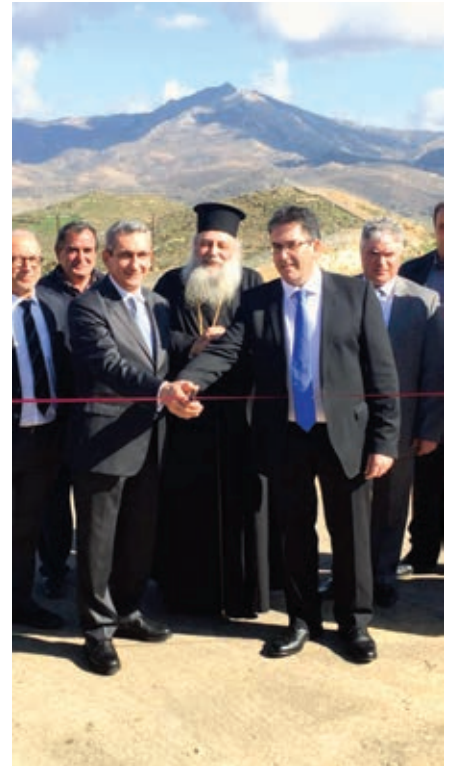
Ο Αντιπεριφερειάρχης Κυκλάδων Γ. Λεονταρίνης, ο Περιφερειάρχης Γ. Χατζημάρκος, ο Σεβ. Μητροπολίτης Παροναξίας Καλλίνικος και ο Δήμαρχος Νάξου και Μικρών Κυκλάδων Γ. Μαργαρίτης κατά την τελετή των εγκαινίων του έργου

Το έργο εγκαινιάστηκε τον Φεβρουάριο από τον Περιφερειάρχη Γιώργο Χατζημάρκο και τον Δήμαρχο Νάξου και Μικρών Κυκλάδων Μανώλη Μαργαρίτη. Όπως ανέφερε χαρακτηριστικά στην ομιλία του ο Περιφερειάρχης « Ίσως κάποιος να αμφέβαλαν ότι το έργο θα προχωρούσε και θα έμπαινε σε λειτουργία, όταν πριν χρόνια ξεκινούσε ο σχεδιασμός του. Η κατασκευή του ήταν κάθε άλλο παρά εύκολη και παρουσιάστηκαν πολλά προβλήματα που δημιούργησαν καθυστερήσεις. Το γεγονός ότι είμαστε σήμερα εδώ, είναι η απόδειξη ότι πιστέψαμε σε αυτό και ότι αυτό που χρειαζόμαστε, αυτό που χρειάζεται πρωτίστως η χώρα μας, είναι η αφοσίωση στον στόχο, η συνεργασία και η σκληρή δουλειά. Η