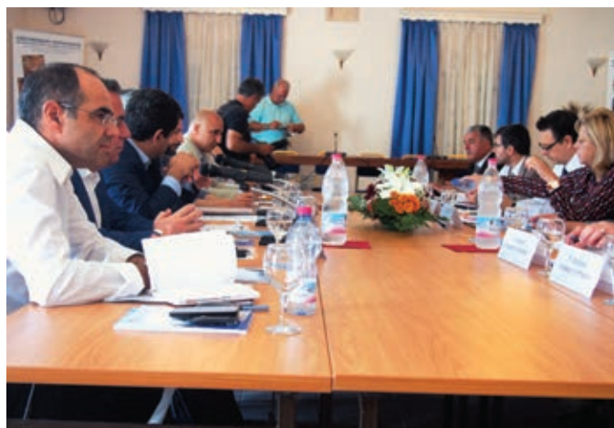
Στιγμιότυπο από τη σύσκεψη