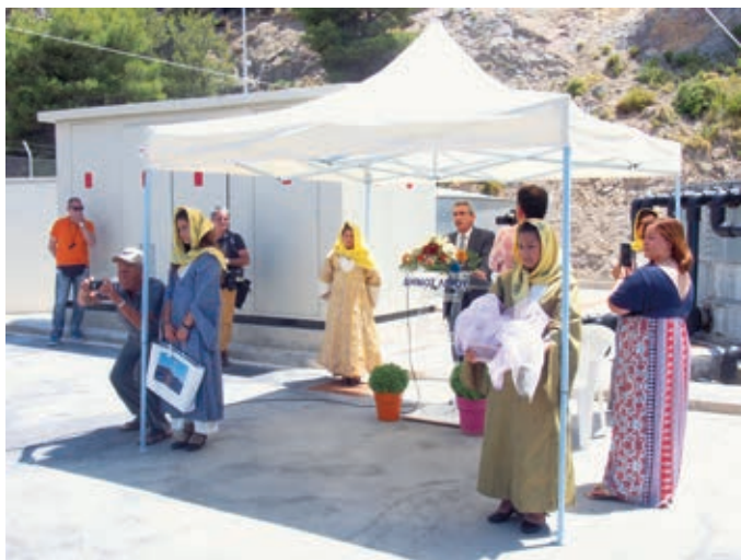
Ο Περιφερειάρχης Γ. Χατζημάρκος κατά την τελετή των εγκαινίων της Αφαλάτωσης

«Το Νότιο Αιγαίο των 670 νησιών και νησίδων, με τα 60 κατοικημένα νησιά, η μεγαλύτερη νησιωτική Περιφέρεια της Ευρώπης, 57 χρόνια μετά, έρχεται αντιμέτωπο με την ιστορική πρόκληση, εάν και κατά πόσον μπορεί να συμμετέχει στο Ευρωπαϊκό όραμα περί χώρου ίσων ευκαιριών, σύμφωνα με την Συνθήκη της Ρώμης», τόνισε ο κ. Χατζημάρκος. «θα έπρεπε να είναι αυτονόητες οι νησιωτικές πολιτικές, στη χώρα με τον μεγαλύτερο αριθμό νησιών στην Ευρώπη. Θα έπρεπε να είναι αυτονόητο ότι η μεγαλύτερη νησιωτική περιφέρεια της Ευρώπης έχει ένα ελάχιστο θεσμικό πλαίσιο που θα της δώσει τη δυνατότητα να διαχειριστεί τις ιδιαιτερότητές της. Τίποτα από αυτά τα αυτονόητα δεν συναντάμε σήμερα, ούτε σε ευρωπαϊκό επίπεδο, ούτε και σε εθνικό επίπεδο. Με τις όποιες ειδικές πολιτικές υπήρχαν για τα νησιά να έχουν καταργηθεί τα δύο τελευταία χρόνια, διαμορφώθηκε μια εξαιρετικά ζοφερή κατάσταση για το Νότιο Αιγαίο. Δίνουμε ένα διαρκή αγώνα, τόσο σε ευρωπαϊκό όσο και σε εθνικό επίπεδο, να αποδείξουμε ότι η στατιστική ισοπέδωση μέσω του ΑΕΠ ως μοναδικό κριτηρίου χρηματοδότησης, έρχεται να λειτουργήσει ως θηλιά για το Νότιο Αιγαίο». Ο Περιφερειάρχης παρουσίασε μάλιστα τα επίσημα στοιχεία της CRPM (της Επιτροπής των Παράκτιων Περιφερειών), σύμφωνα με τα οποία, επί τρία συνεχόμενα χρόνια, το Νότιο Αιγαίο είναι η Περιφέρεια με τη μεγαλύτερη πτώση του ΑΕΠ στην Ευρώπη, κατά 35 ποσοστιαίες μονάδες.