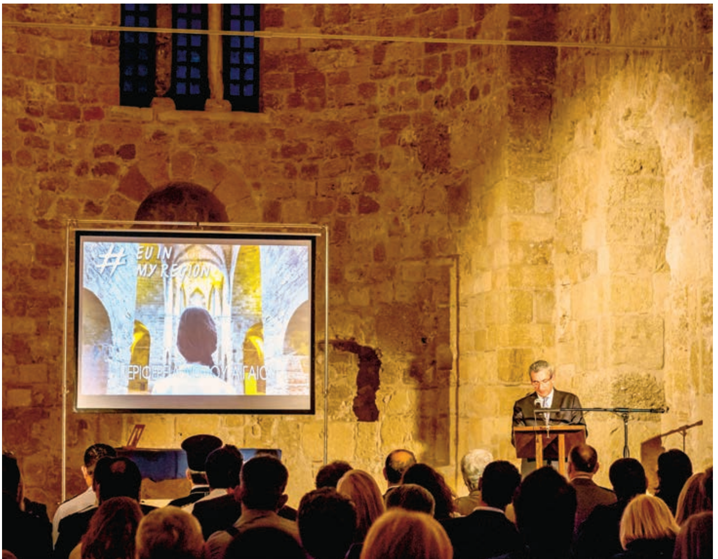
Ο Περιφερειάρχης Γ. Χατζημάρκος κατά την εκδήλωση στην Παναγία του Κάστρου στη Ρόδο

Για πρώτη φορά φέτος η Περιφέρεια Νοτίου Αιγαίου συμμετείχε στην καμπάνια με δύο πολύ πετυχημένες εκδηλώσεις.