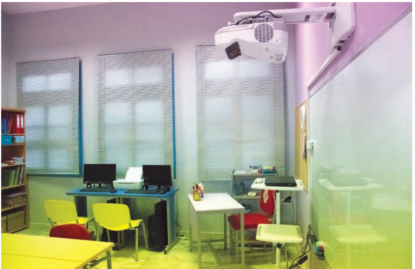
Αίθουσες διδασκαλίας του δημοτικού σχολείου