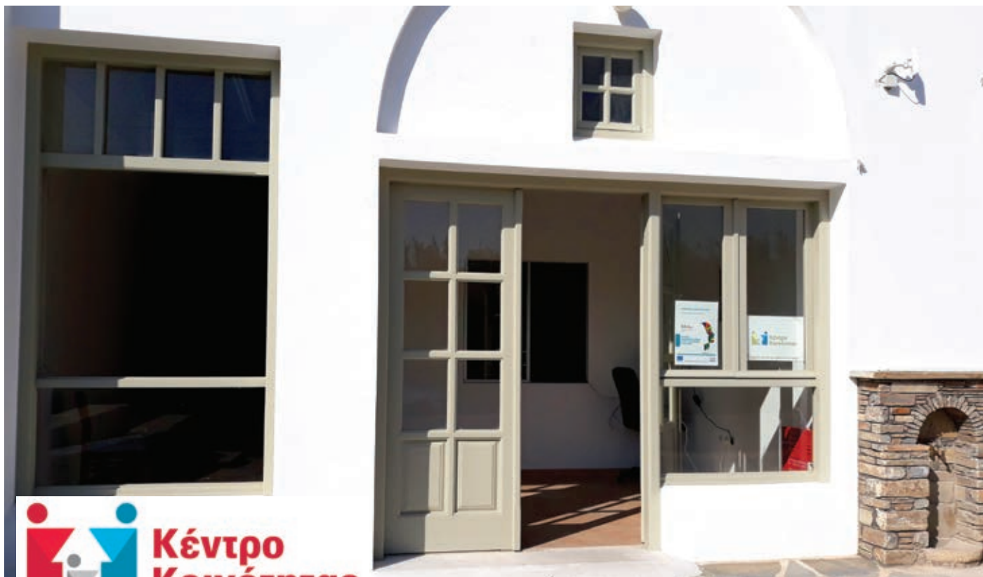
Κέντρο Κοινότητας Νάξου