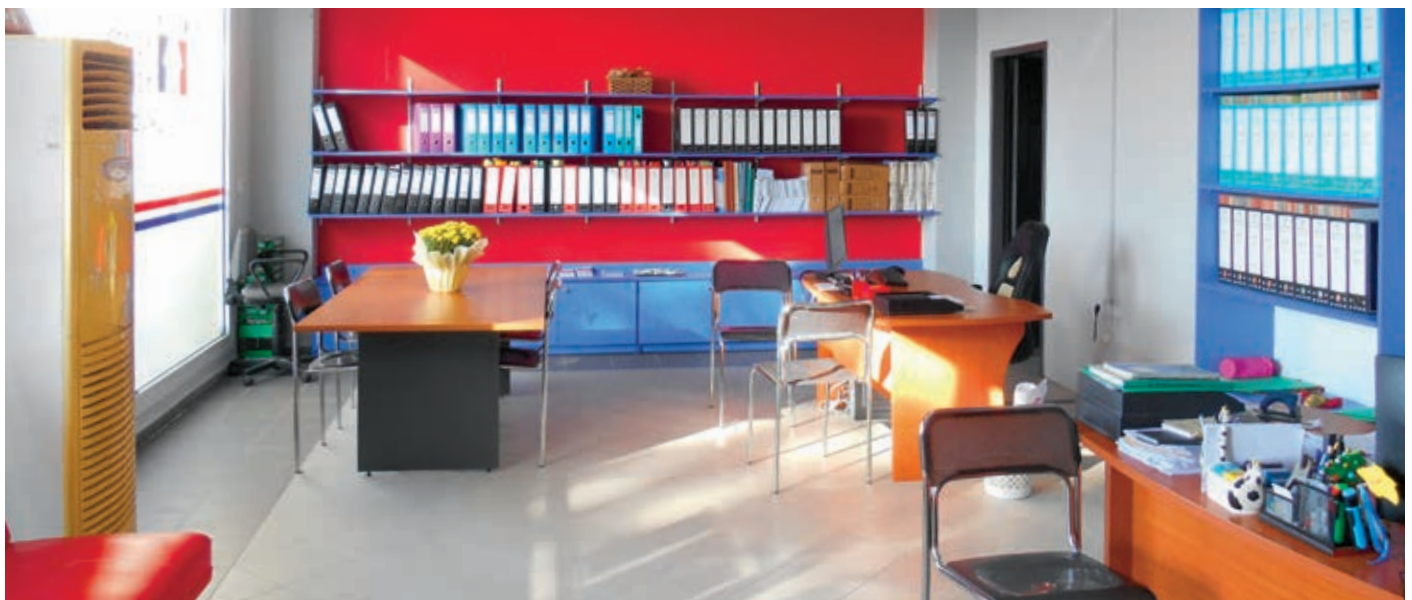
Κέντρο Κοινότητας Λέρου

Συνολικά λοιπόν, τα Κέντρα Κοινότητας στην Περιφέρεια Νοτίου Αιγαίου αποτελούν ένα σύγχρονο δίκτυο κοινωνικών δομών με δυνατότητα παροχής ποιοτικών υπηρεσιών απ' άκρη σε άκρη της Περιφέρειας. Οι αυξημένες ανάγκες στον τομέα της πρόνοιας, και όχι μόνο, αποτέλεσμα της παρατεταμένης οικονομικής ύφεσης καθιστούν επιτακτική την ανάγκη για ενεργό ρόλο της Τοπικής Αυτοδιοίκησης. Ειδικά για τη νησιωτική μας Περιφέρεια, όπου το πρόβλημα της απουσίας ή της υποστελέχωσης των κοινωνικών δομών είναι ιδιαίτερα έντονο, είναι σίγουρο ότι με την ανάλογη στήριξη από την πλευρά της πολιτείας –ώστε να καταφέρει να έχει διάρκεια και μετά την προβλεπόμενη τριετία- η λειτουργία των Κέντρων αυτών θα συμβάλει αποφασιστικά στην αναβάθμιση των παρεχόμενων υπηρεσιών.