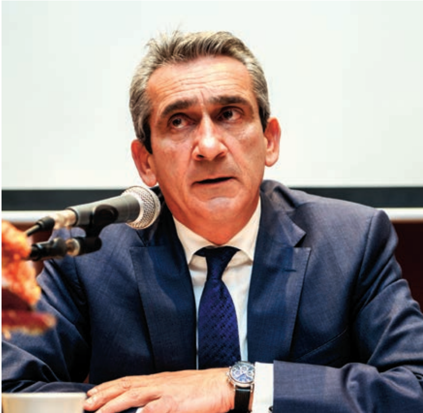
Γιώργος Χατζημάρκος (Περιφερειάρχης Νοτίου Αιγαίου)