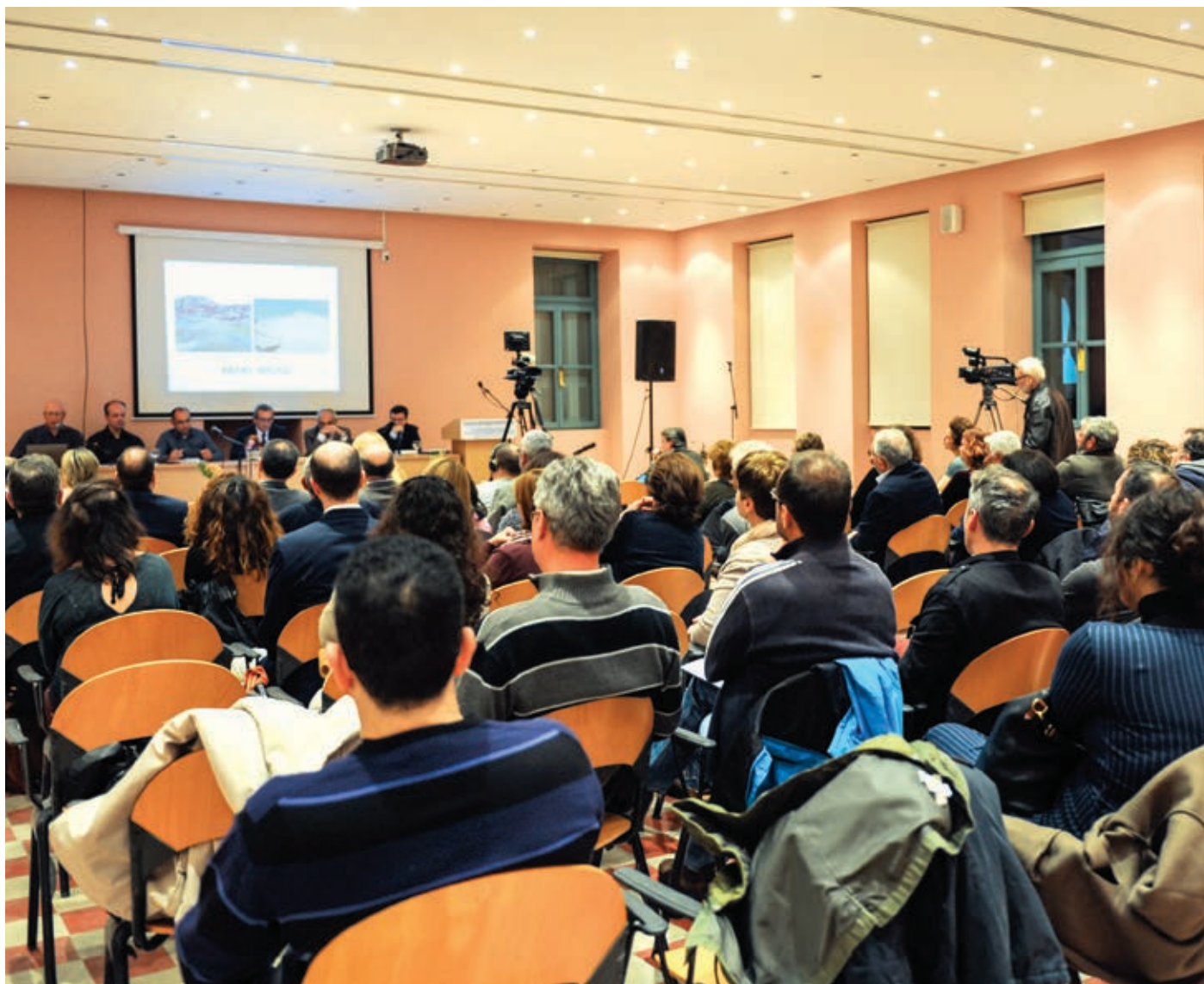
Στιγμιότυπο από την επικοινωνιακή εκδήλωση