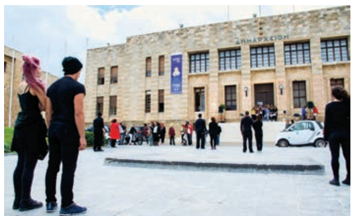
Δράσεις ενημέρωσης και ευαισθητοποίησης από τις Δομές Υποστήριξης Γυναικών Δήμου Ρόδου (Κέντρο Συμβουλευτικής Υποστήριξης Γυναικών και Ξενώνας Φιλοξενίας Γυναικών)