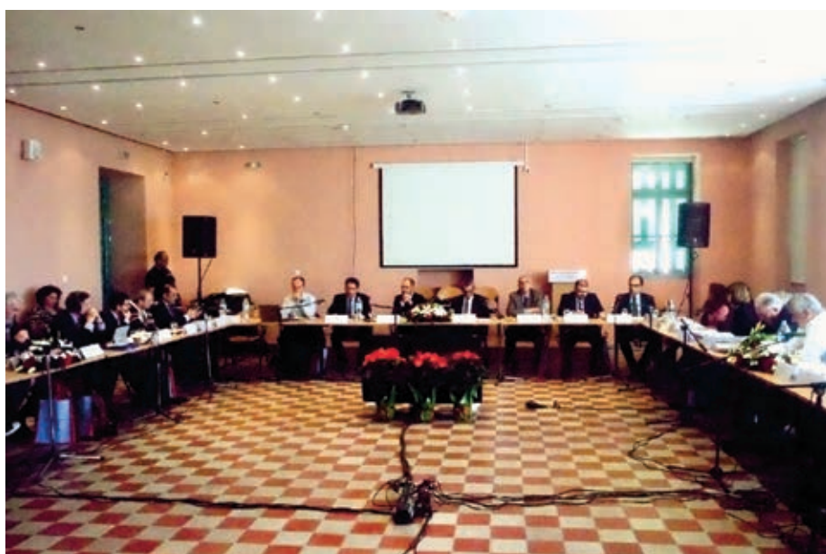
Από τη συνεδρίαση της Επιτροπής Παρακολούθησης