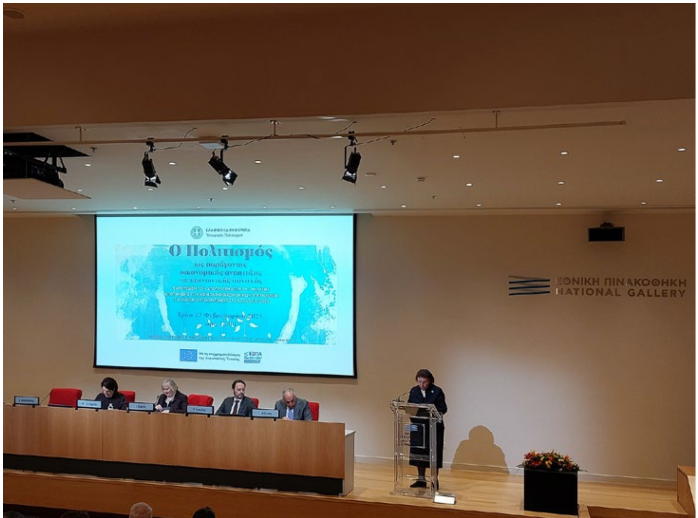
Η Υπουργός Πολιτισμού Λίνα Μενδώνη κατά την ομιλία της