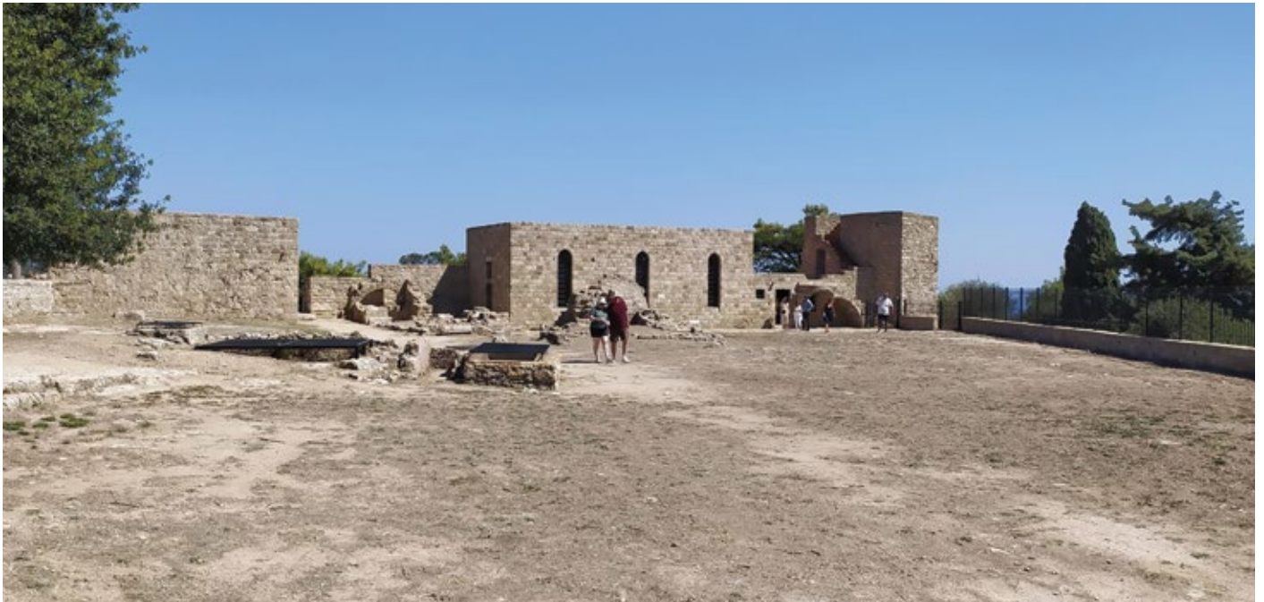
Ανάδειξη αρχαιολογικού χώρου Φιλερήμου Ρόδου

Στις 31/12/2023 έληξε η περίοδος υλοποίησης για το Επιχειρησιακό Πρόγραμμα Νοτίου Αιγαίου 2014-2020, που όπως ήταν αναμενόμενο βάσει της πορείας του έληξε με τον καλύτερο τρόπο, αφού κατάφερε όχι μόνο να απορροφήσει πλήρως τους πόρους του (€154,8 εκ.), αλλά και να τους υπερκαλύψει.