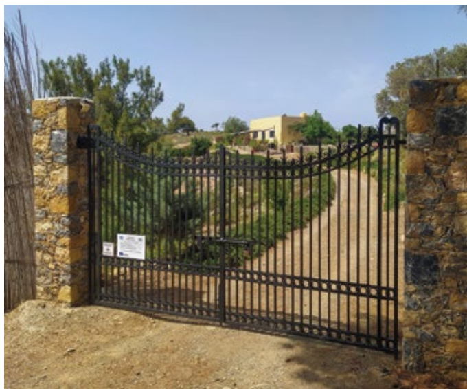
Κοινωνικός Συνεταιρισμός του Τομέα Ψυχικής Υγείας Δωδεκανήσου

καλλιέργεια βοτάνων καθώς και με την ανάπτυξη ενός πρότυπου κέντρου προστασίας και αναπαραγωγής μελισσών. Στην καρδιά του κτήματος στέκει επιβλητικά ένα ιστορικό μνημείο – απομεινάρι της Ιταλοκρατίας – ένας εγκαταλελειμμένος στρατώνας (caserma), ο οποίος αποκαταστάθηκε με σεβασμό και μετατράπηκε σε πολυχώρο δημιουργικών και εκπαιδευτικών δραστηριοτήτων αλλά και σε κατάστημα για τα προϊόντα του ΚοιΣΠΕ. Η Caserma είναι ένας βιωματικός προορισμός όπου οι επισκέπτες μπορούν να γνωρίσουν τον κόσμο των βοτάνων της Λέρινης γης και τη θαυμαστή κοινωνία της μέλισσας. Παράλληλα, προσφέρει την ευκαιρία για ένα ταξίδι στην πλούσια και ταραχώδη ιστορία του νησιού, στην τοπική παράδοση, σε γαστρονομικές εμπειρίες και τη γνωριμία με τα προϊόντα του συνεταιρισμού.