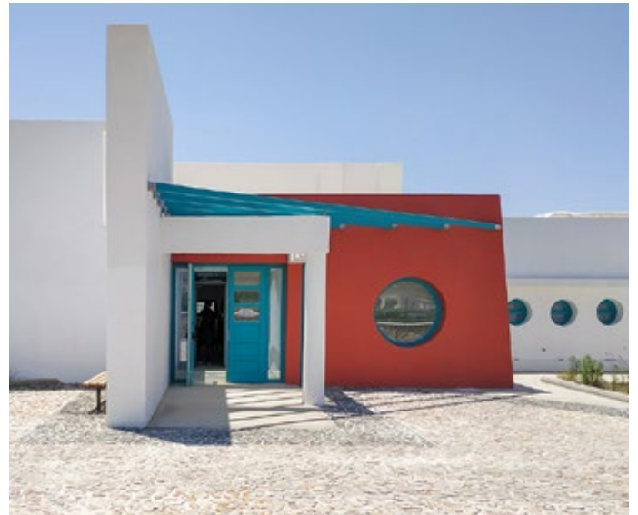
Βρεφονηπιακός Σταθμός Εμπορείου Θήρας

νείς για τα τροφεία βρεφονηπιακών σταθμών και κέντρων δημιουργικής απασχόλησης). Από τα προγράμματα αυτά από το 2015 έως το 2022 ωφελήθηκαν πάνω από 700-800 οικογένειες κατ' έτος,