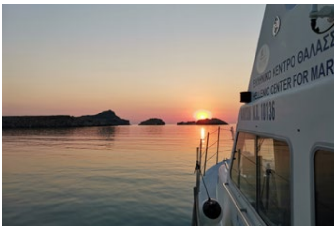
Ερευνητική υποδομή Υδροβιολογικού Σταθμού Ρόδου