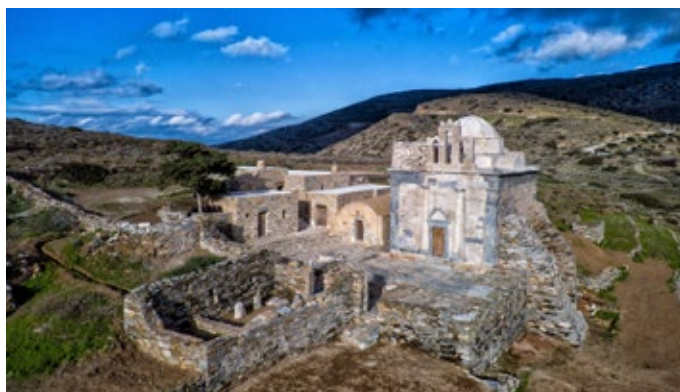
Αποκατάσταση ναού Επισκοπής Σικίνου