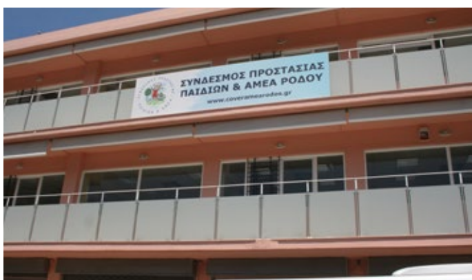
Στέγες Υποστηριζόμενης Διαβίωσης ΑμεΑ στη Ρόδο