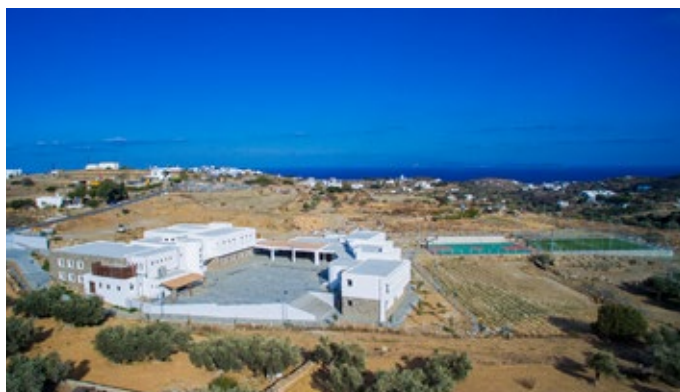
Δημοτικό Σχολείο Σίφνου