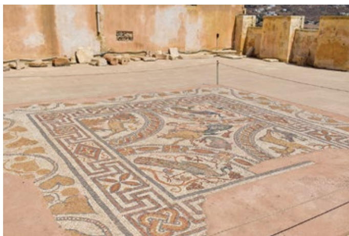
Νάξος, Νησίδα μουσείων Κάστρου