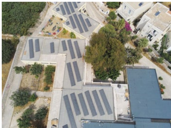
Ενεργειακή αναβάθμιση κτιριακού συγκροτήματος Λυκείων Σύρου