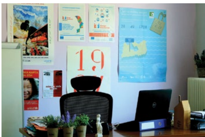
Μήλος, Κέντρο Κοινότητας